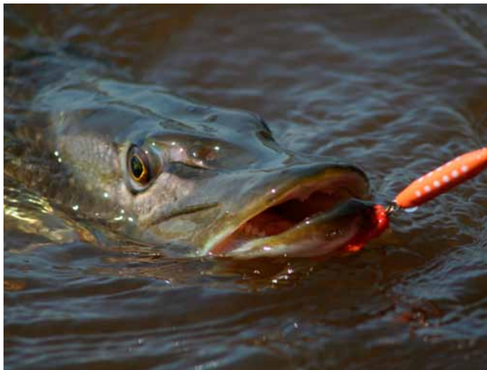
Nu er det sæson for geddefiskeri.