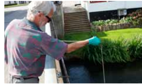
Med en spand opsamles vand fra Kongeå.

kæmpe arten, der truer fiskebestanden. Også i Nørreå ved Sommersted har en bestand etableret sig – men om Aller Å hidtil er gået fri vides ikke.